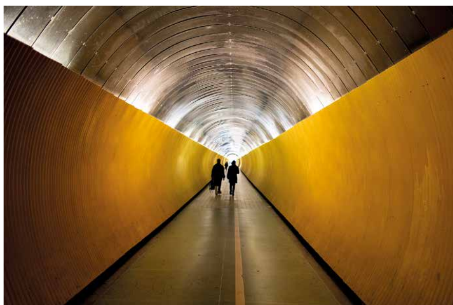
Le tunnel, 2019 (Stockholm, Sweden)