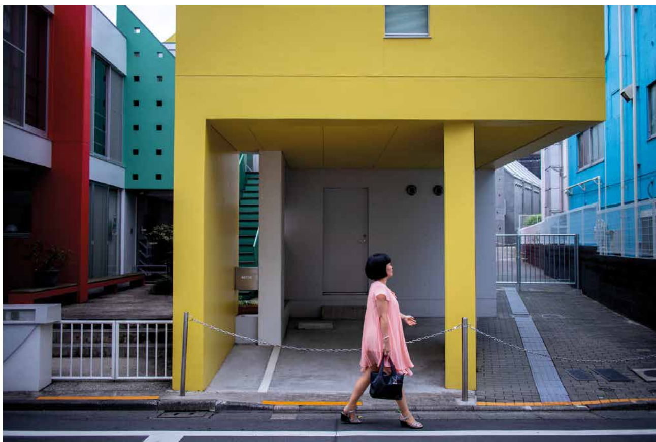
Fashion Police, 2019 (Tokyo, Japon)