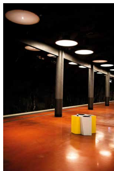
Le Quai, 2019 (Stockholm, Sweden)