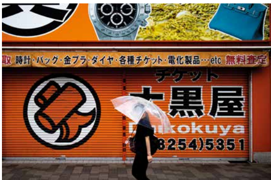
Pluie sur Akihabara, 2019 (Tokyo, Japan)

Diplômé en communication visuelle, il passe vingt années en tant que Directeur Artistique dans le monde du marketing et de la publicité qui lui ont permis de se forger une véritable expertise sur le pouvoir de l'image. L'histoire familiale au sein du studio photographique créé par son arrière-grand père à Levallois-Perret pendant près d'un demi-siècle constitue un héritage qu'il a désormais envie de prolonger et d'enrichir de sa vision.