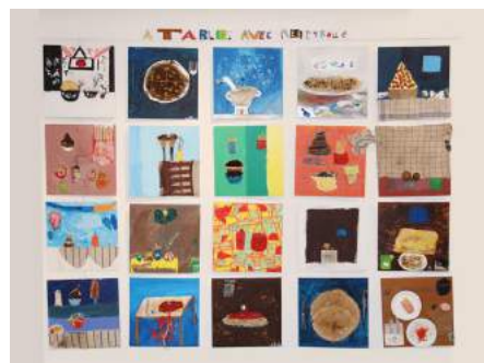
A table avec Rebeyrolle

Reprise des cours le 21 septembre pour les enfants et les adolescent-e-s (12-16 ans)