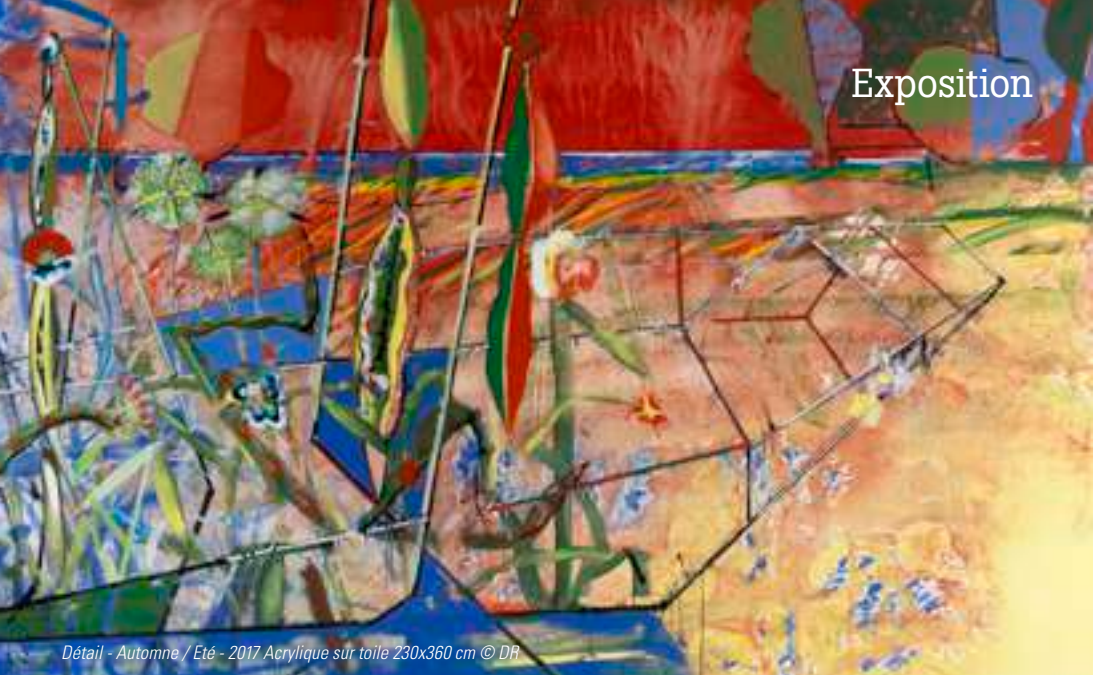
Détail - Automne / Été - 2017 Acrylique sur toile 230x360 cm © DR

DU VENDREDI 30 SEPTEMBRE AU SAMEDI 5 NOVEMBRE