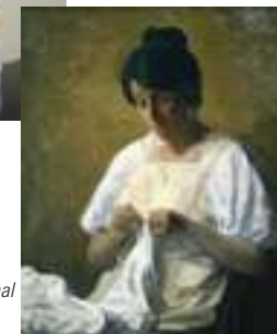
Victorine reprise © François Maréchal