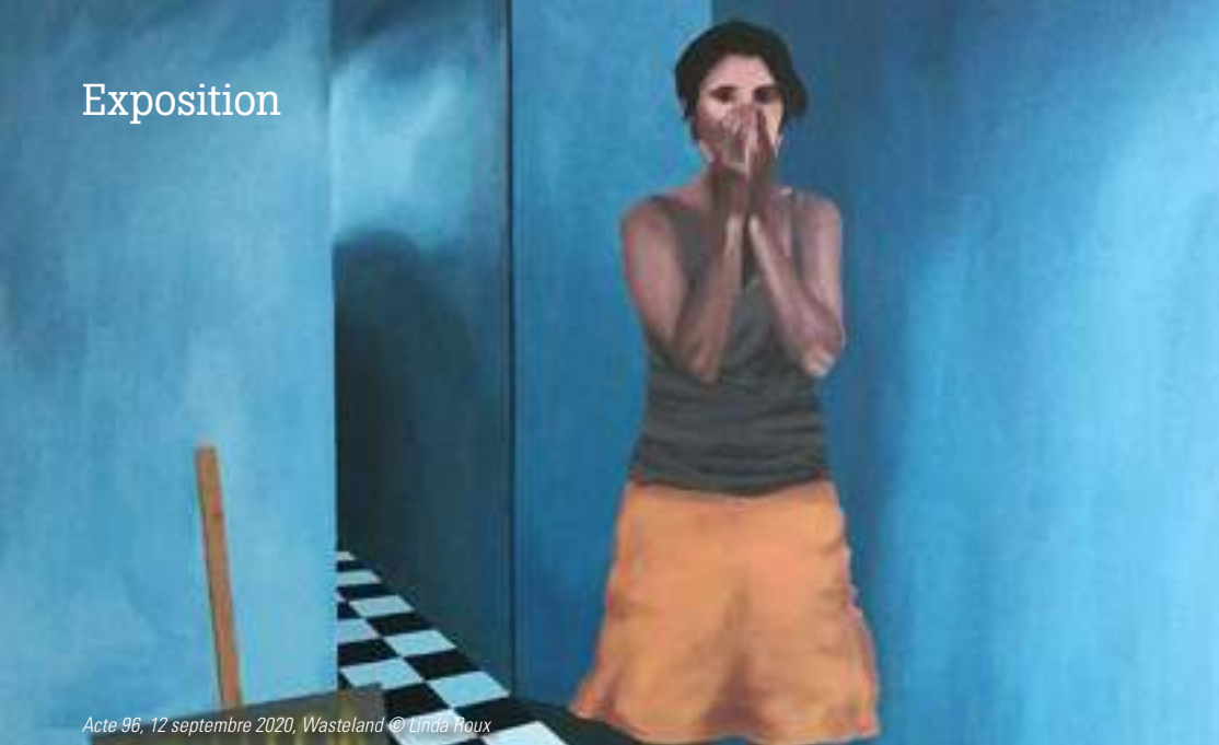
Acte 96, 12 septembre 2020, Wasteland