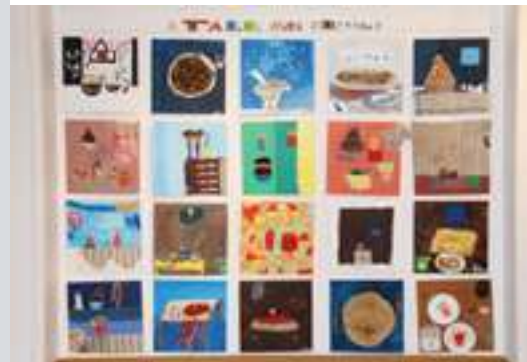
A table avec Rebeyrolle