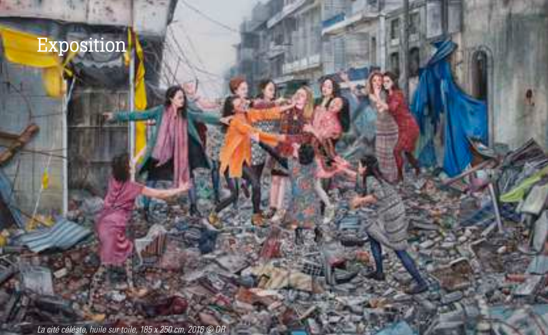
La cité céleste, huile sur toile, 185 x 250 cm, 2016

DU VENDREDI 18 NOVEMBRE AU SAMEDI 7 JANVIER