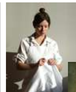
Juliette reprise