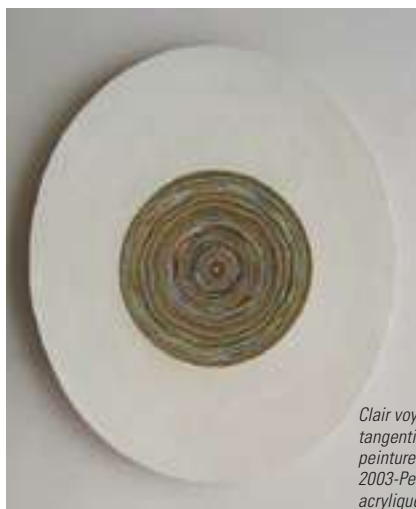
Clair voyant tangentielle-série des peintures inversées- 2003-Peinture acrylique tapis assiette © Al Martin