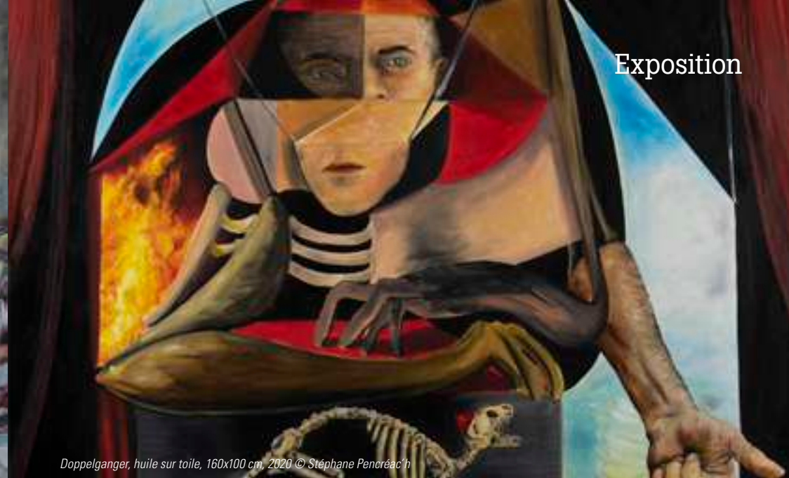
Doppelgänger, huile sur toile, 160x100 cm, 2020 © Stéphane Pencreac'h

Guillaume Morel dans Connaissance des arts mai 2020