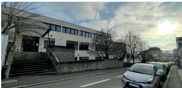
Rue Cauchy, les locaux de la CAVB seront réhabilités pour accueillir le nouvel hôtel de ville.

participant-e à la réunion publique. « Cela fait prendre un retard considérable au projet », a-t-on pu entendre. En réalité, ce sont les conséquences de la pandémie et les élections en 2020 qui expliquent le décalage de calendrier. Le précédent projet avait créé des crispations sur la tour Signal, la localisation de la galerie d'arts plastiques ou encore la hauteur des immeubles. La crise sanitaire notamment a montré qu'il était utile de prendre du temps pour construire des aménagements compatibles avec les grands enjeux. « Nous nous inscrivons dans le courant de la « slow démocratie ». Ce n'est pas grave de prendre son temps, explique Sophie Lericq. Nous apprenons des expériences passées. Par exemple en termes de hauteur, on voit bien que le bâtiment à l'angle Bar-