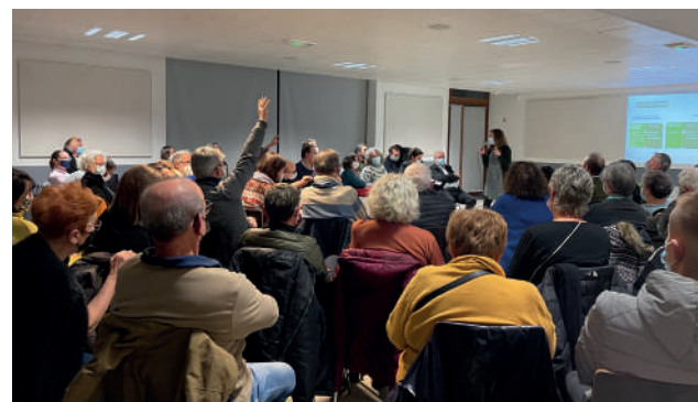
De nombreux points ont été abordés par les Arcueillais-es présent·e·s à la réunion.

jeux climatiques actuels est primordiale. La municipalité, qui a fait de la transition écologique l'un des axes majeurs de son programme, a ici accru ses exigences et réinterrogé le scénario d'abord envisagé (voir p.6), qui prévoyait la réhabilitation de l'actuel hôtel de ville. L'urbanisme circulaire (lire le P'tit dico p.7) est un enjeu important. Réutiliser un bâtiment existant entre dans cette logique. Cela a poussé la Ville à réhabiliter les locaux de 7000 m 2 de l'ancienne Communauté d'agglomération du Val-de-Bièvre (CAVB), repris ensuite par le Grand-Orly Seine Bièvre qui n'en a aujourd'hui plus l'usage. Bien d'autres raisons ont fait apparaître cette solution comme le choix gagnant : regroupement de la plupart des agent·e·s municipaux sur un seul site, gain considérable d'espaces (locaux des services techniques rue de Stalingrad, de la galerie d'arts plastiques, de l'espace jeunes...), nouvelles opportunités foncières, travaux simplifiés, etc. Ce changement de scénario a ému plus d'un·e