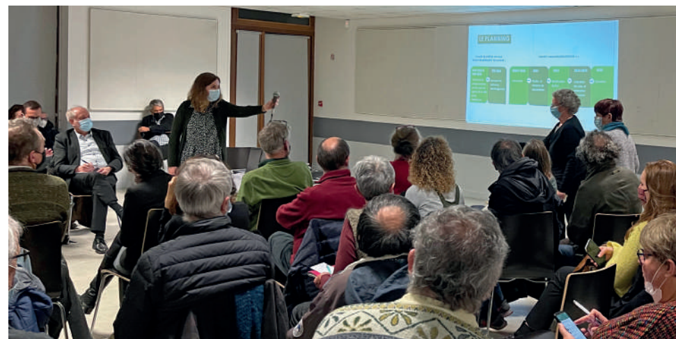
La parole sera donnée à la population tout au long du projet, car la concertation en est un élément-clé.