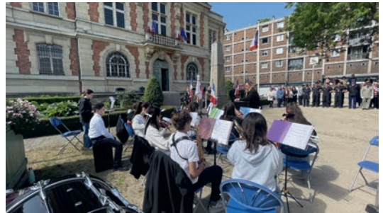
Archives : Commémoration organisée le 8 mai 2025

Vendredi 8 mai , la ville célèbre la victoire du 8 mai 1945. La commémoration commence à 10h30 au cimetière (entrée avenue Paul Vaillant-Couturier) avec un dépôt de gerbes et un moment de recueillement devant la crypte des déportés et le carré militaire. Elle se poursuivra à 11h devant le monument aux morts place de la République, pour une cérémonie en présence d'élus et d'officiels. Les élèves de 3 e du club Histoire et l'orchestre du collège Dulcie September proposeront également des parenthèses musicales et historiques. La matinée sera clôturée par un vin d'honneur au centre Marius Sidobre. ●